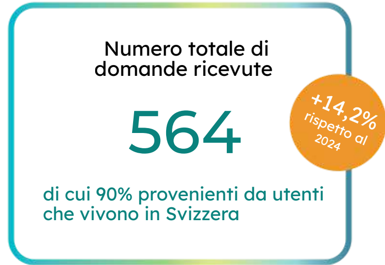
Distribuzione delle domande in base alla provenienza (svizzera o straniera)